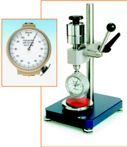
Elcometer 3120 肖氏硬度计