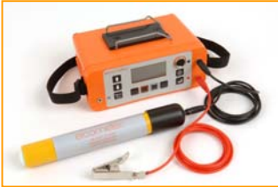
Elcometer 3312 带半电池探头

Elcometer 3312 2 保护层测试和半电池测试仪不仅可以定位钢筋位置和走向、保护层厚度、和钢筋直径，同时还可以根据半电池法测试钢筋锈蚀情况。