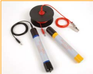
Elcometer 3312 半电池测试包