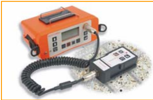
Elcometer 331 2 B 保护层测试仪

Elcometer 331 2 保护层测试和半电池测试仪不仅可以定位钢筋位置和走向、保护层厚度、和钢筋直径，同时还可以根据半电池法测试钢筋锈蚀情况。