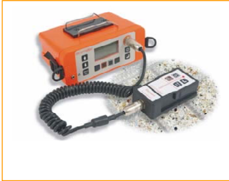
Elcometer 331 2 保护层测试仪和半电池测试装置