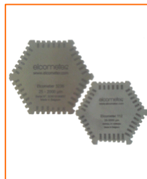
Elcometer 112 & 3236

Diese gestanzten Aluminiumkämme sind eine preiswerte Alternative zur Messung der Nassfilmdicke. Erhältlich im 10er-Pack mit metrischen Einheiten (25 - 3000 \mu\text{m} ) auf einer Seite und imperialen Werten (1 - 118 mil) auf der anderen.