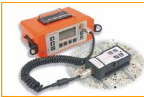
Elcometer 331 2 B Betondeckungsmessgerät

Elcometer 331 2 Betondeckungsmessgeräte mit Halbzelle ermöglichen dem Anwender nicht nur die Ortung, Lagebestimmung und Ermittlung von Tiefe und Durchmesser der Bewehrung, sondern auch die Erfassung des Potentials der Korrosion vereint in einem einzigen Gerät!