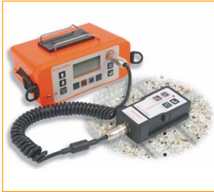
Elcometer 331 2 Betondeckungsmessgerät