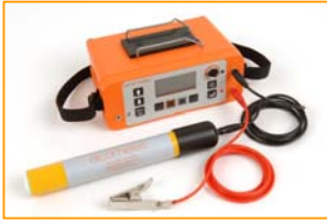
Elcometer 331 2 mit Halbzelle und Messwertspeicher