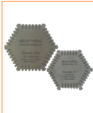
Peines hexagonales para película húmeda Elcometer 112 y 3236