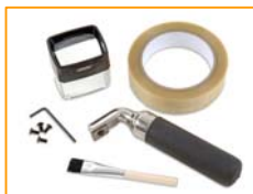
Cortador de Trama Cruzada Elcometer 107

Elcometer 195 La taladradora Säberg trabaja de una manera diferente a como lo hacen los medidores de inspección de pintura. Mientras que los MIP trazan un corte en línea a lo largo del revestimiento, el Taladrador Säberg hace un pequeño horificio para poder medir el espesor en la capa, reduciendo el daño en el revestimiento en que se va a realizar las pruebas.