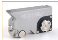
MIP Elcometer 121/3

Elcometer 141 Medidor para inspección de pintura que es un método rápido y versátil para la examinación y medición de revestimientos presentado en forma portátil y fácil de usar. Ergonómicamente diseñado para dar una distribución balanceada del peso para producir cortes más precisos-aún en revestimientos gruesos y duros.