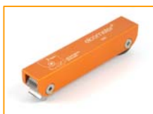
Cortador de Trama Cruzada para Adhesión Elcometer 1542

Elcometer 107 El revestimiento tiene que ser continuo y lucir bien, pero ¿que tan bien esta conectado al sustrato? El cortador de trama cruzada Elcometer 107 provee una evaluación instantánea de calidad del unión al sustrato. Dada su resistencia, este medidor es ideal para revestimientos delgados, gruesos o en superficies curvas o planas. Es ideal para su uso en pruebas de laboratorio o campo de trabajo.