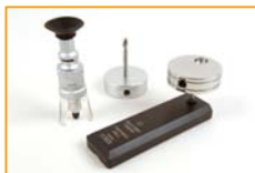
Taladradora Säberg Elcometer 195

Elcometer 121/3 El Medidor para Inspección de Pintura Universal (MIP) Elcometer 121/3 provee un método rápido y versátil para la examinación y medición del tipo destructivo de espesor de pintura y cortador de trama cruzada para medir adhesión, todo esto integrado en un solo instrumento.