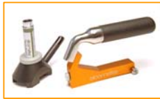
MIP Elcometer 141

Elcometer tiene una gran variedad de otros equipos para la prueba y medición de las características de revestimientos: