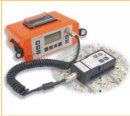
Medidor de cobertura de hormigón con media celda Elcometer 331 2

Este instrumento facil de usar y muy preciso, le permitirá localizar, orientar y medir el grosor de la cobertura de hormigón sobre las barras de refuerzo metálicas.