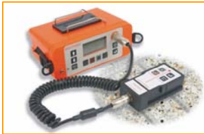
Medidor de cobertura de hormigón Elcometer 331 2 B

El medidor de cobertura de hormigón con media celda Elcometer 331 2 le informara de la localización, orientación, grosor de la cobertura y diámetro de la barra de refuerzo dentro de la estructura de hormigón y ahora también le ayudará a conocer las probabilidades de corrosión de la estructura metálica dentro del hormigón, todo esto en un solo instrumento.