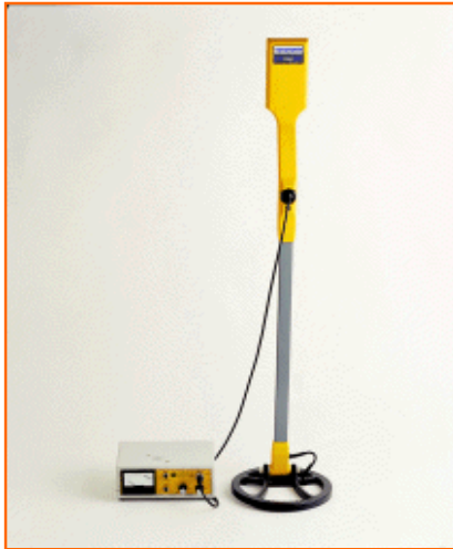
Detector de metales de profundidad Elcometer P520